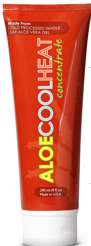
240 毫升 / 8 安士