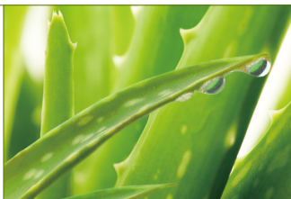
Whole Leaf Aloe