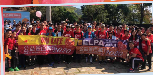
人材濟濟，聚首一堂