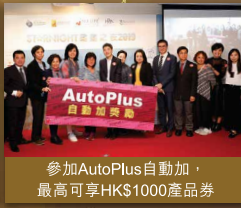
參加AutoPlus自動加, 最高可享HK$1000產品券