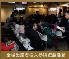
全場出席者投入參與遊戲活動