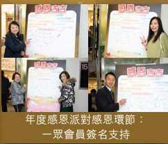
年度感恩派對感恩環節: 一眾會員簽名支持