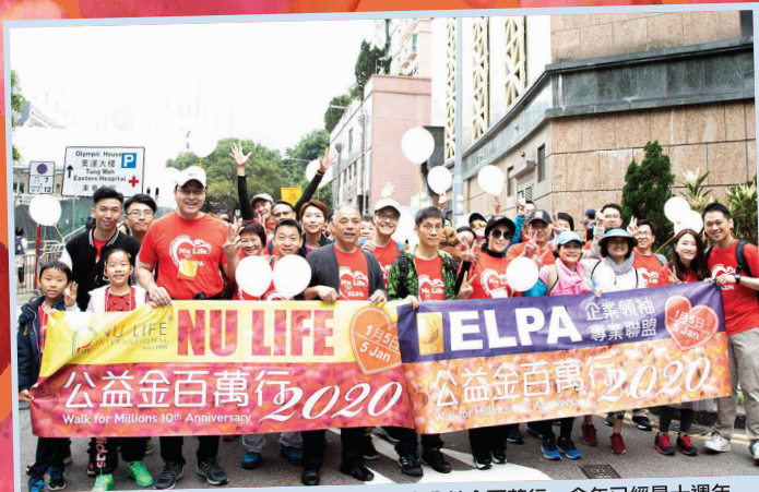
ELPA 與 NU LIFE 身體力行，聯合參與2020年度公益金百萬行，今年已經是十週年