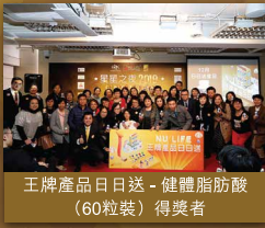
王牌產品日日送 - 健體脂肪酸 (60粒裝) 得獎者