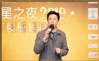
文總監為大家公布 「健腸運動教育及推廣中心」的活動