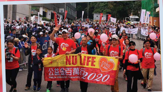
一馬當先，正式起步