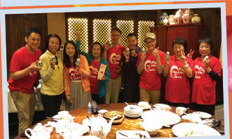
完成全程，大吃一頓