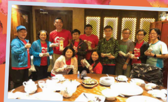
完成全程，大吃一頓