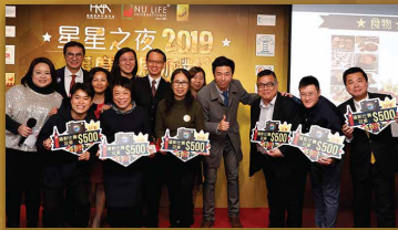
一眾倫敦之旅攝影比賽得獎者