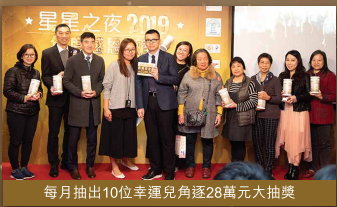
每月抽出10位幸運兒角逐28萬元大抽獎