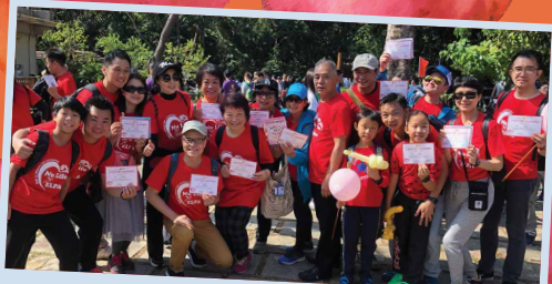
感謝一眾善丈人翁