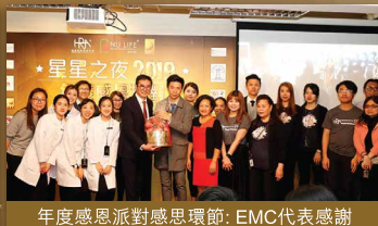
年度感恩派對感恩環節: EMC代表感謝 眾同事及營養師